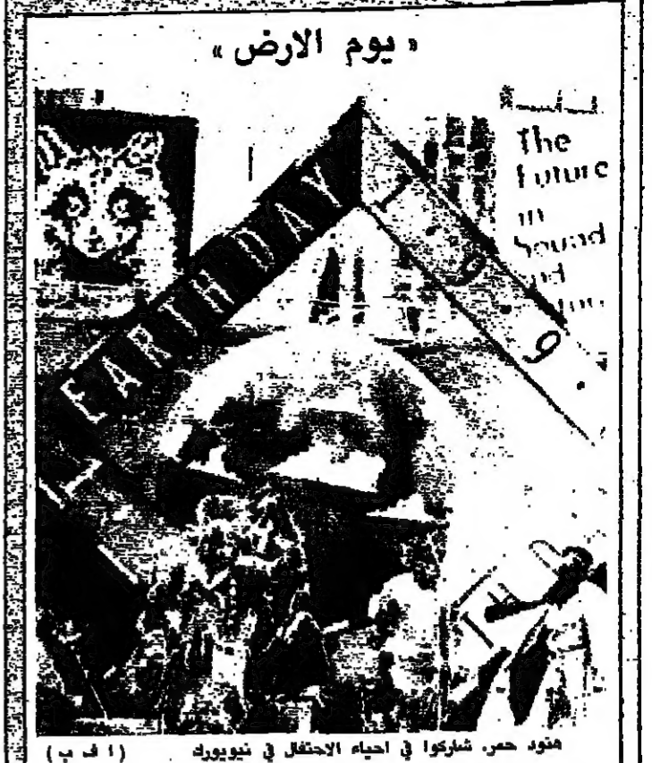
مئود حرس شاركوا في احياء الاحتفال في نيويورك